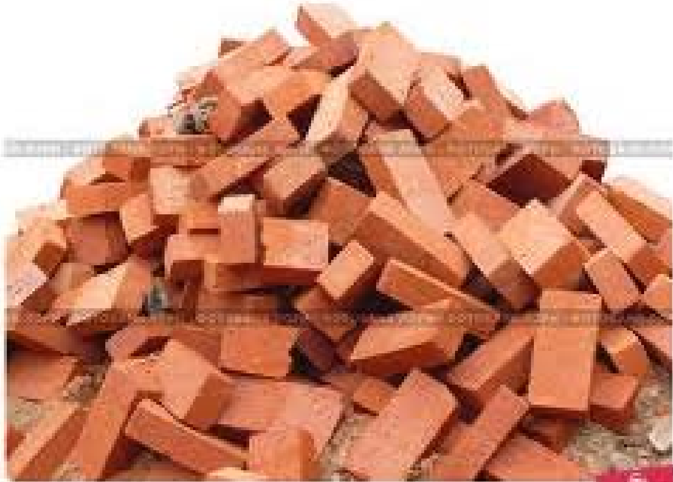
Куча цегленки на белом фоне